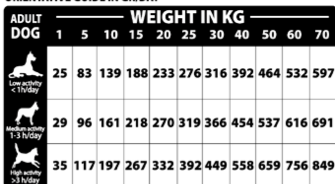
ORIENTATIVE GUIDE IN GR/DAY

Pregnant: Increase feeding 25% - 50%. Lactaction: Feed "free choice"